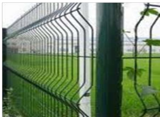
Nome: Curvy welded fence Ref.: 211/1052