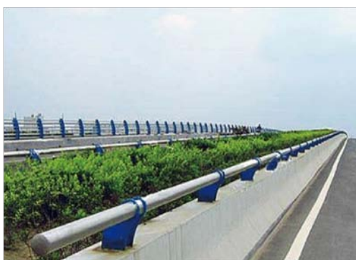
Nome: Highway Guardrail Ref.: 215/1052

A especificação técnica, em detalhe, de cada um dos produtos ser-vos-á fornecida a pedido. Os acabamentos e dimensões poderão variar de acordo com os requisitos do cliente