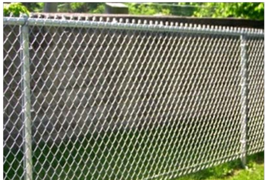
Nome: Chain Link Fence Ref.: 204/1016