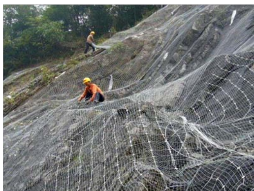
Nome: Safety netting system Ref.: 218/1002