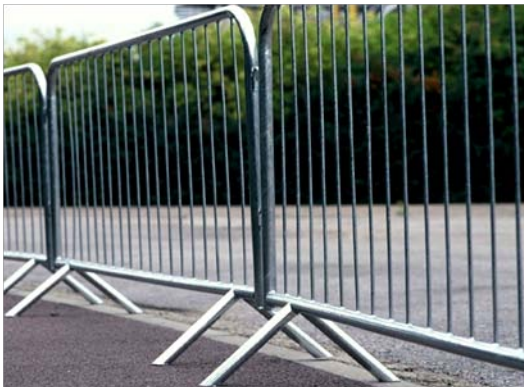
Nome: Temporary fence Ref.: 202/1003