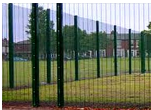
Nome: High security fence Ref.: 221/1001