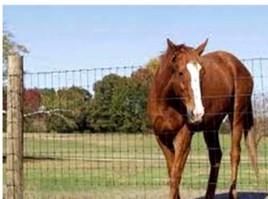
Nome: Field Fence Ref.: 204/1052

A especificação técnica, em detalhe, de cada um dos produtos ser-vos-á fornecida a pedido. Os acabamentos e dimensões poderão variar de acordo com os requisitos do cliente