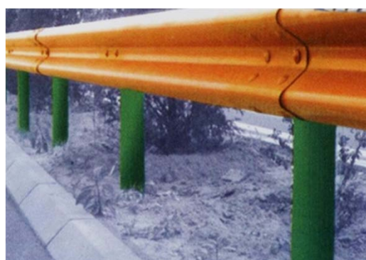
Nome: "W" Highway Guardrail Ref.: 215/1062