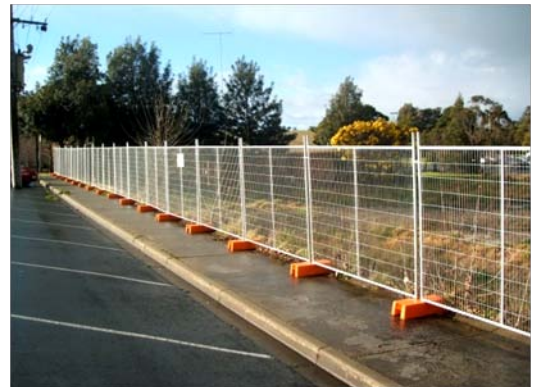
Nome: Temporary fence Ref.: 202/1014