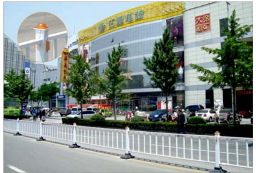
Nome: Steel road fence Ref.: 215/1027