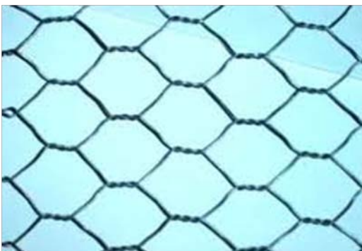
Nome: Hexagonal wire mesh Ref.: 213/3388