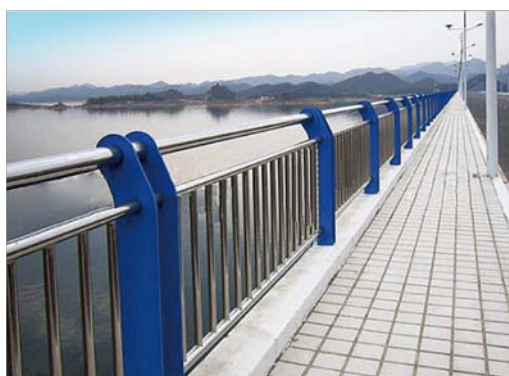
Nome: Rail bridge guardrail Ref.: 215/1059