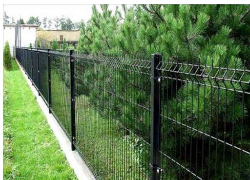
Nome: Euro Fence Ref.: 211/1015