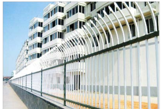
Nome: Framework Fence Ref.: 203/2007