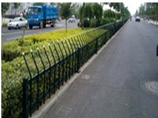
Nome: Steel lawn fence Ref.: 211/1045

A especificação técnica, em detalhe, de cada um dos produtos ser-vos-á fornecida a pedido. Os acabamentos e dimensões poderão variar de acordo com os requisitos do cliente