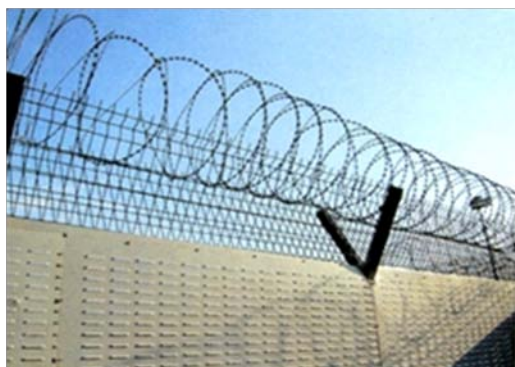
Nome: Barbed Wire Ref.: 218/2011