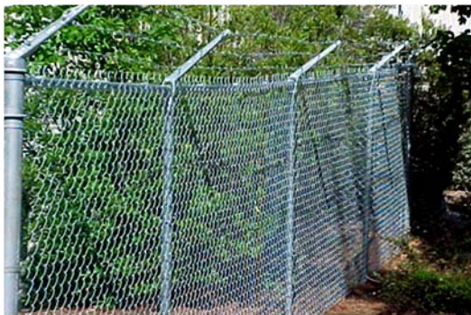
Nome: Chain Link Fence Ref.: 204/1011