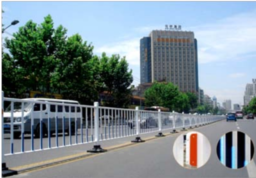
Nome: Steel road fence Ref.: 215/1015

A especificação técnica, em detalhe, de cada um dos produtos ser-vos-á fornecida a pedido. Os acabamentos e dimensões poderão variar de acordo com os requisitos do cliente.